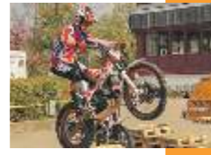
Parcours des MSC

Am Wochenende, 7. und 8. April, organisiert der Motor-Sport-Club-Marbach (MSC) auf dem Gelände rund um die Schulen und die Stadionshalle zum 40. Mal die große Auto- und Motorradausstellung. Mitglieder des Stadtmarketing sind dabei und freuen sich auf Ihren Besuch.